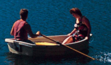
Gebirgssee Zauchensee (1.350 m) mit Blick zur höchsten Erhebung Altenmarkt-Zauchensees, der Steinfeldspitze (2.344 m) Mountain lake in Zauchensee (1,350 m) with views over the highest peak of Altenmarkt-Zauchensee, the Steinfeldspitze (2,344 m)